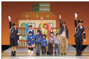
親と子の交通安全ミュージカル