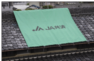
JA共済災害シートの提供