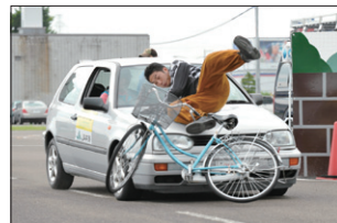
生徒向け自転車交通安全教室