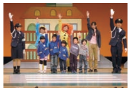
親と子の交通安全ミュージカル(幼児向け)