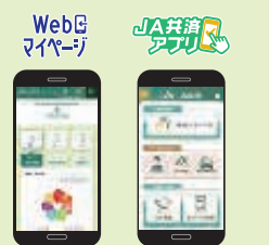
「Webマイページ」と「JA共済アプリ」のトップ画面

また、JA共済ご契約者さま向け専用インターネットサービス「Webマイページ」に「自動車共済の継続手続き」機能を追加、どなたでも利用できるスマートフォン向け「JA共済アプリ」に「防災アラートメール」「避難場所マップ」「洪水ハザードマップ」といった防災機能のコンテンツを拡充するなど、さらなる組合員・利用者の皆さまの利便性向上に向けて取り組んでいます。