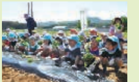
保育園児に向けた農業体験の実施

被災された組合員等への災害救援活動や交通事故対策活動など、従来から継続的に取り組んできた地域貢献活動に加え、地域・農業の活性化のため、地域の実情に応じた「くらしや営農」に貢献するさまざまな活動に取り組んでおり、令和5年度の地域貢献活動は、JA共済各都道府県本部で約5,200件、そのうちJAを通じて行われた活動は、約4,800件となりました。