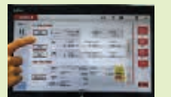
ペーパーレス手続き(イメージ)

共済契約の申し込みの際に、タブレット型端末機を活用したペーパーレス化や、クレジットカード等による共済掛金のキャッシュレス化を実施しています。