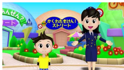
「JA共済 小学生向け交通安全教育DVD 『基本編』」

JA共済連では、今回の小学生向けの交通安全教育資材に加え、既存の各種交通安全啓発活動を通じて、今後とも、事故のない安全・安心な地域づくりに取り組んでまいります。