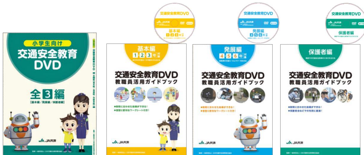
オリジナルファイルケース (左)