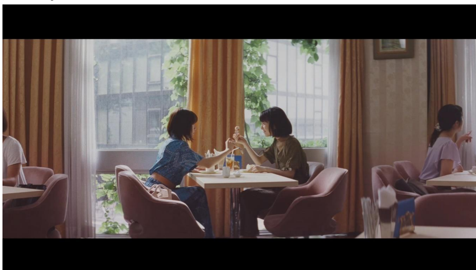
生活障害共済 第2弾TV-CM『イチゴ』篇

仲睦まじい美人姉妹のチャーミングでコミカルな演技と、第1弾CMの初々しさから成長した有村LAの姿を是非、ご覧ください。