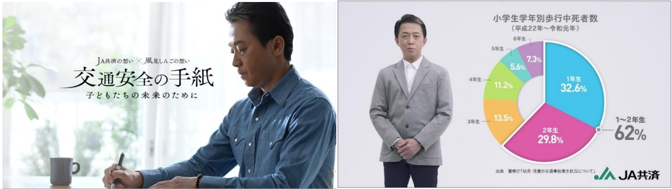
「JA共済の想い×風見しんごの想い 交通安全の手紙 ～子どもたちの未来のために～」 特設サイト画面（左）動画カット（右）