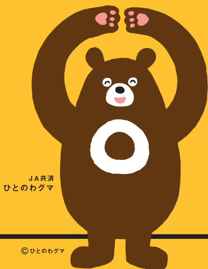
JA 共済 ひとのわぐま

お客様の大切な現金等重要物をお預かりする際は、 受取書・領収書等 を 必ずお渡ししております。