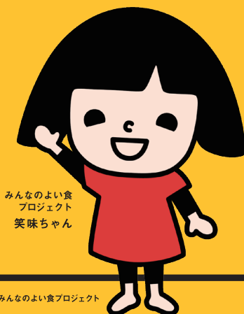
みんなのよい食 プロジェクト 笑味ちゃん