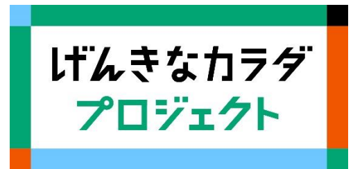
げんきなカラダプロジェクトのロゴ

J A 共済では、仕組みによる保障と、リスク予防・未然防止に資するサービスを一体的に提供し、皆さまに「切れ目なく寄り添う」ため、令和3年4月から健康増進活動『げんきなカラダプロジェクト』を展開し、専用ホームページやWebマイページ、J A 共済アプリなどを活用し、J A グループ各団体やヘルスケア関連企業とも協業して、健康増進に関する幅広いサービスを提供しています。