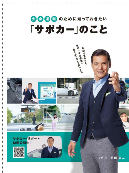
パンフレット(表紙)