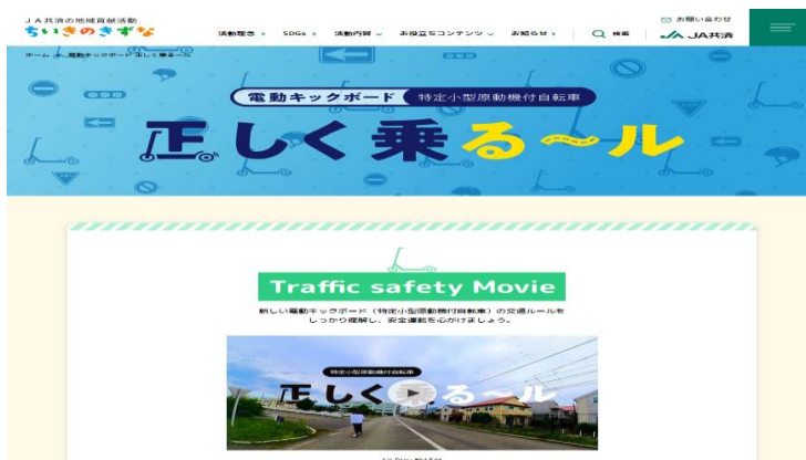
『電動キックボード(特定小型原動機付自転車)正しく乗る〜ル』 特設WEBサイト トップ画面

『電動キックボード（特定小型原動機付自転車）正しく乗る〜ル』の動画がご視聴いただけるほか、電動キックボード（特定小型原動機付自転車）を安全に活用するためのポイントをまとめた啓発チラシも公開。PDF形式でダウンロードができるため、学校や地域などでの交通安全教育にもご活用いただけます。