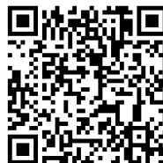
特設 WEB サイト QRコード (URL： https://social.ja-kyosai.or.jp/tokuteikogata/ )