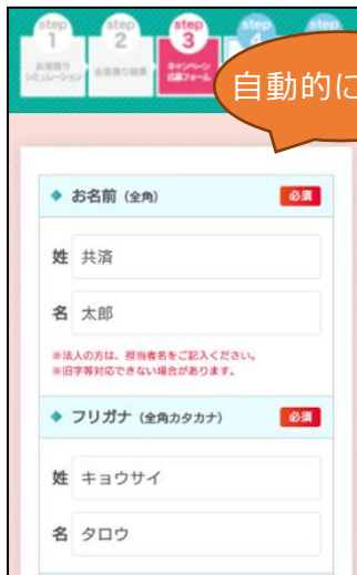
⑦自動反映された項目を確認 その他必要な情報を入力