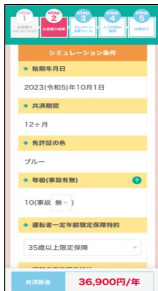
⑤お見積り結果を表示