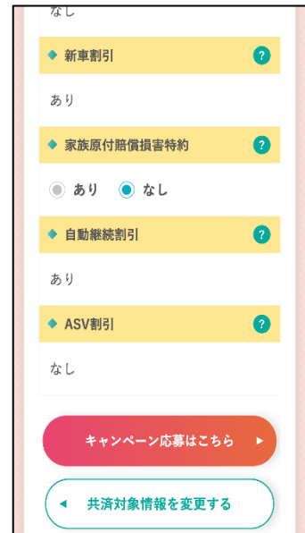
⑥「キャンペーン応募はこちら」を押下