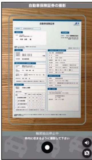
①スマートフォンで証券を撮影