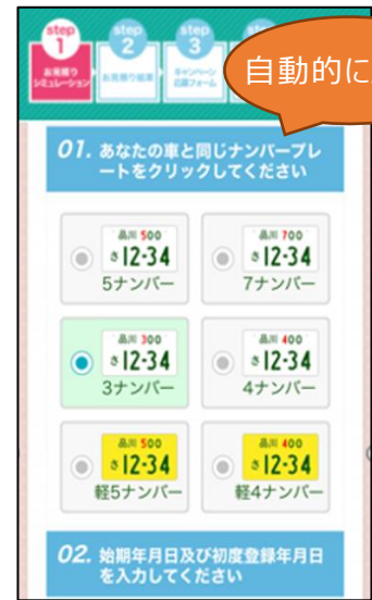
③自動反映された項目を確認 その他必要な情報を入力