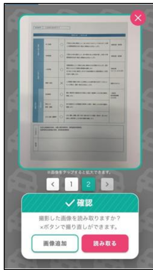
②証券情報の読取を実行