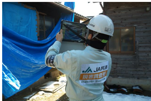
Lablet's を用いた損害調査