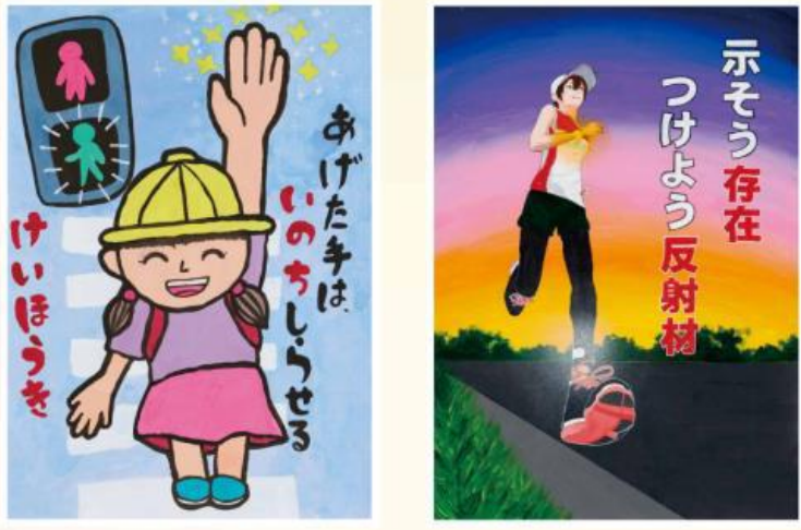
【ポスターコンクール受賞作品イメージ】