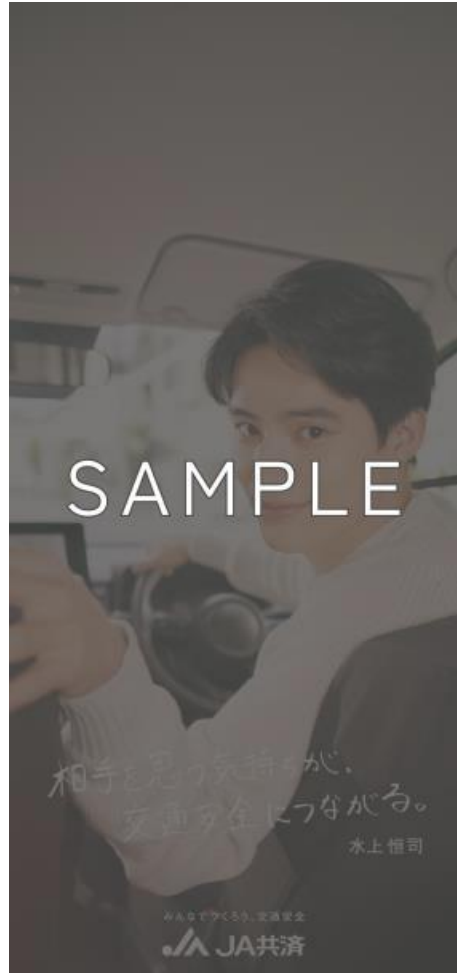
【オリジナル壁紙イメージ】