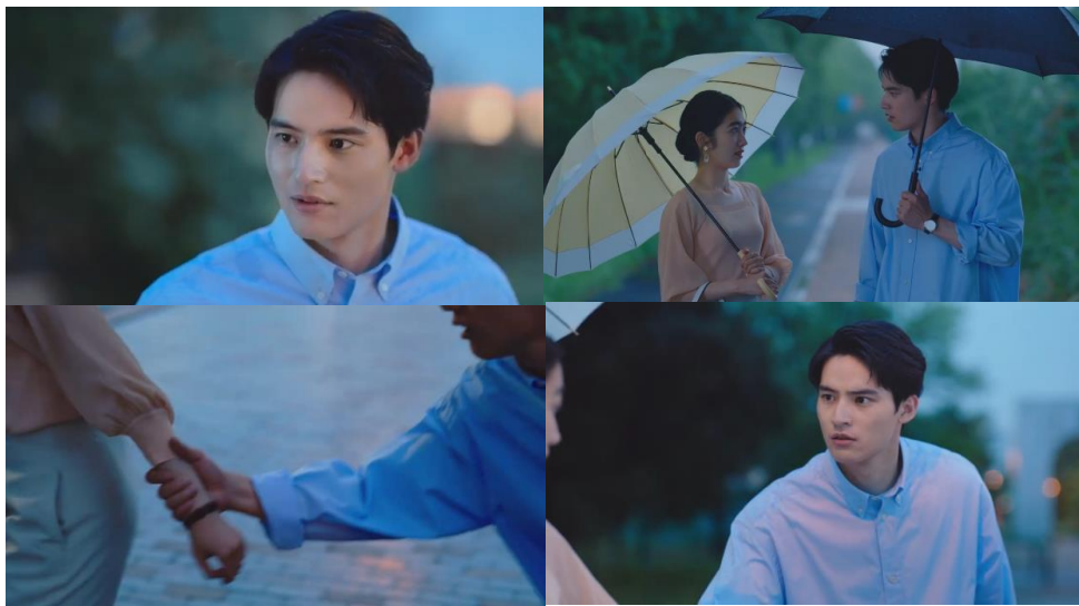
【オリジナルドラマキャプチャ】